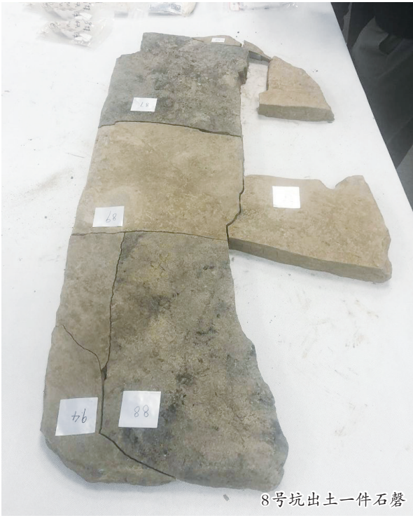
8号坑出土一件石磬