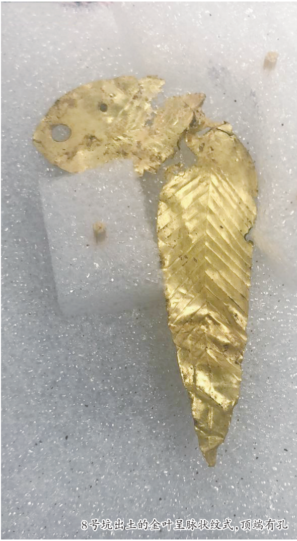
8号坑出土的金叶呈脉状纹式,顶端有孔