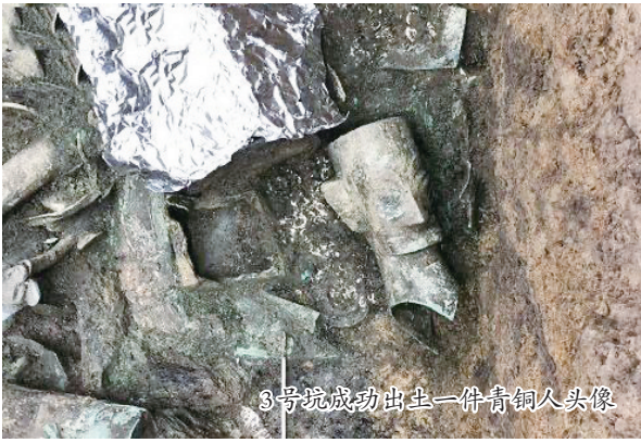
3号坑成功出土一件青铜人头像