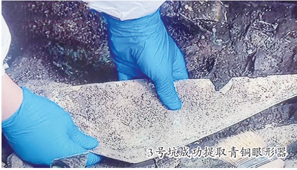
3号坑成功提取青铜眼形器