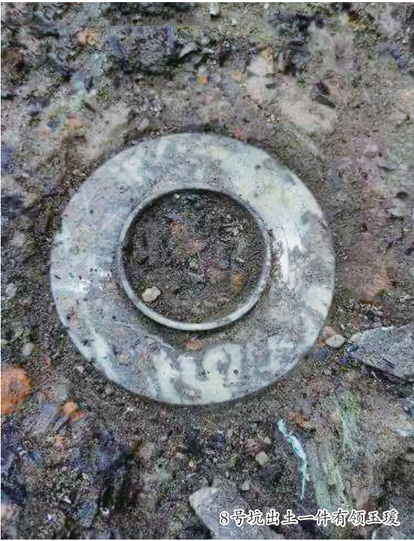
8号坑出土一件有领玉瑗