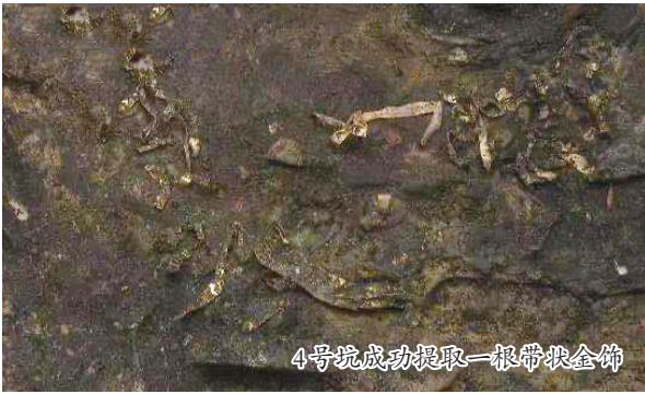
4号坑成功提取一根带状金饰