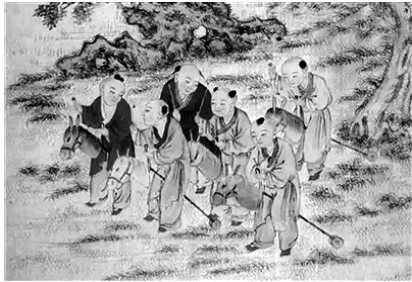
清代焦秉贞《百子团圆图》