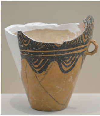
这是5月27日拍摄的山遗址的新石器时代彩陶罐。