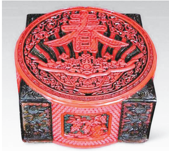
彩漆深雕春字花卉盒