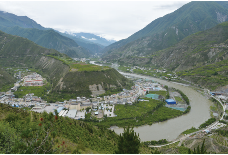
这是5月27日拍摄的位于四川茂县的营盘山遗址。