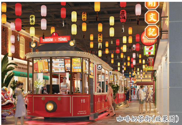
咖啡奶茶街(效果图)