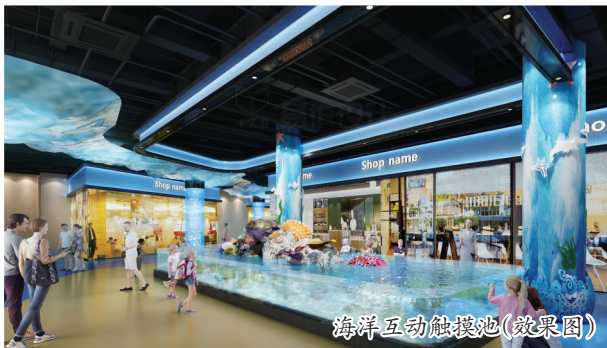
海洋互动触摸池(效果图)