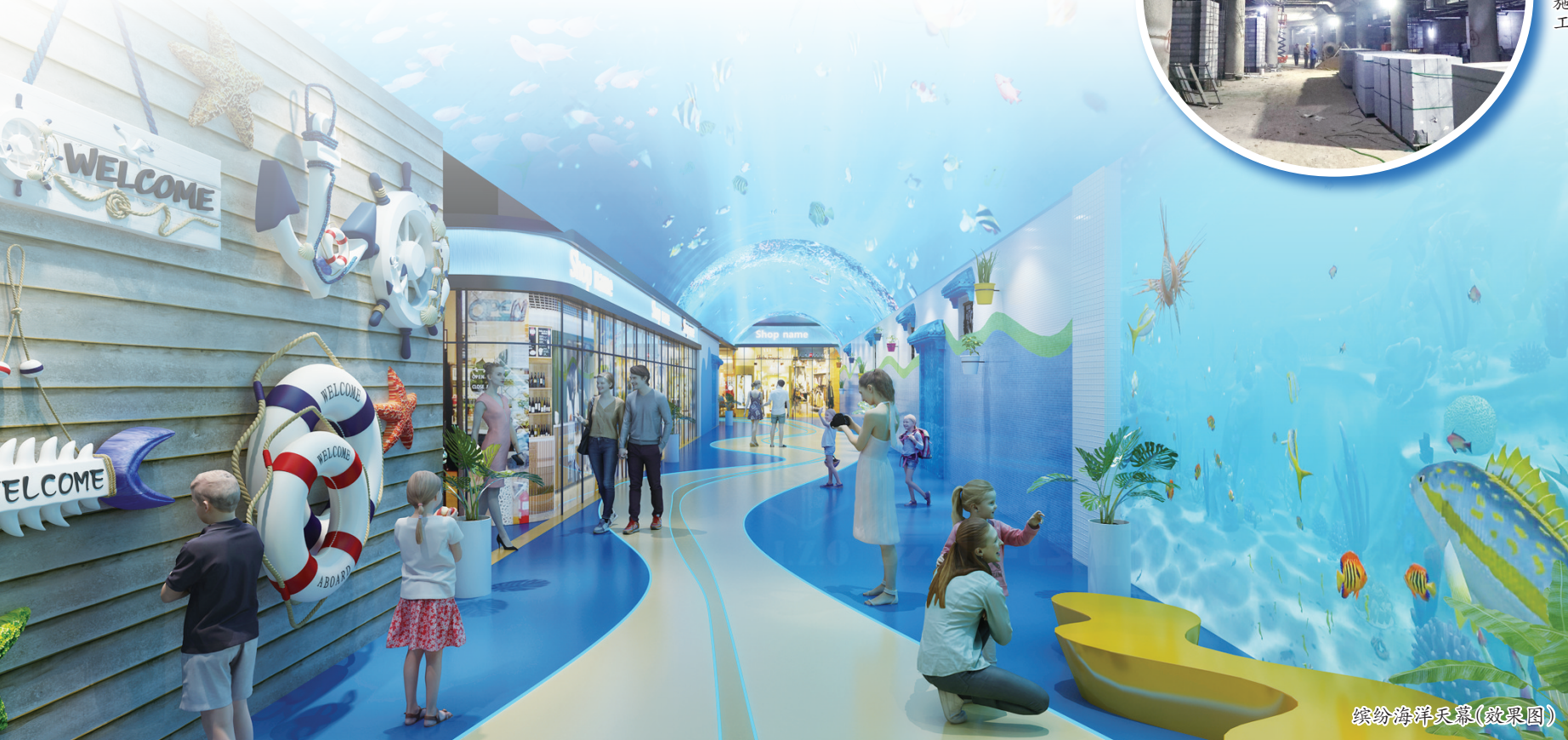
缤纷海洋天幕(效果图)