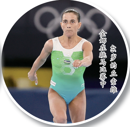
金娜在跳马比赛中 6岁的丘索维