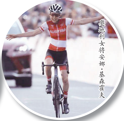
奥地利女将安娜·基森霍夫