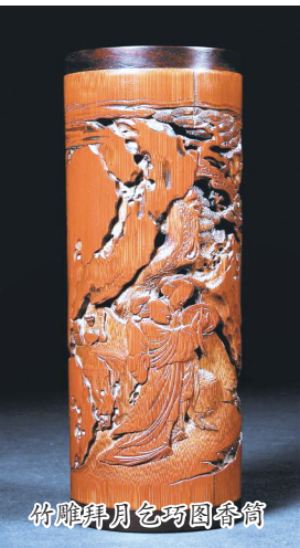
竹雕拜月乞巧图香筒

月亮象征着团圆、浪漫,与七夕节的气氛甚为贴近,因此,在我国古代许多地区,都流传着拜月乞巧的风俗。农历七月初七前夕,相互熟识的女子们一起商议拜月之事的相关事情。拜月前,她们须先沐浴,然后换上美丽的新衣,花枝招展地聚集。她们步履轻盈,笑靥如花,为节日增添了一抹生动的色彩。拜月仪式并不复杂。在庭院内摆放一张小桌,桌上