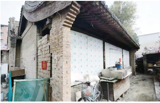
「孤魂庙」被包围在一所居民院落中

2020年上半年,玉泉区检察院对玉泉区文物保护情况进行了彻底排查,逐一筛查国家、自治区、市县几级保护名录所载的文物,实地了解其保护现状。当排查到文物保护单位“东岳天齐庙”时,检察官们发现了问题。根据资料记载,“东岳天齐庙”俗称“孤魂庙”,建于清朝乾隆年间,占地面