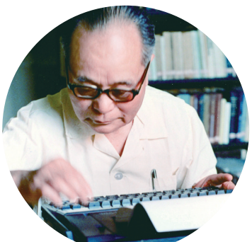
这是程开甲在打字机上撰写论文(资料照片)。