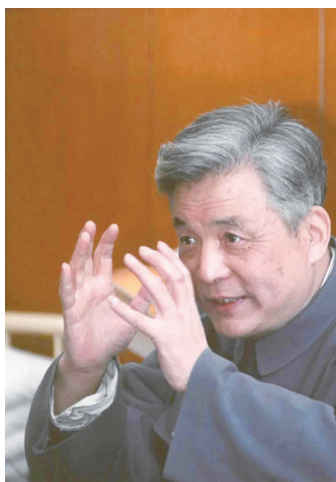
这是邓稼先(资料照片)。

岁月更迭,精神弥坚。“两弹一星”的爱国奉献精神,深深融入一代代科技工作者的血液中。