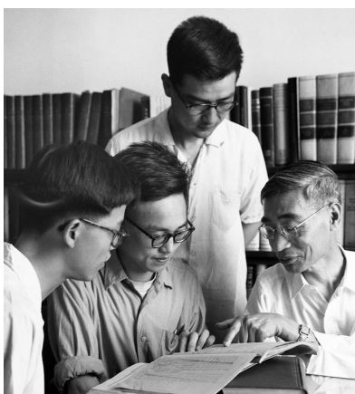
这是郭永怀(右一)在解答研究生提出的问题(资料照片)。(据新华社报道)