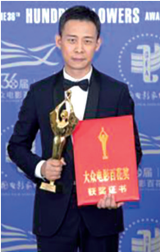
张译凭借《悬崖之上》获得最佳男主角奖

7月30日晚，第36届大众电影百花奖在湖北武汉揭晓，象征着中国电影“百花齐放”的奖杯金光熠熠。生动诠释了伟大的抗美援朝精神的电影《长津湖》获得最佳影片奖，袁泉凭借抗疫题材电影《中国医生》中的表现获得最佳女主角奖，张译凭借在《悬崖之上》中的表现获得最佳男主角奖。优秀影片、最佳编剧、最佳导演、最佳男配角、最佳女配角、最佳新人等奖项也分别揭晓。