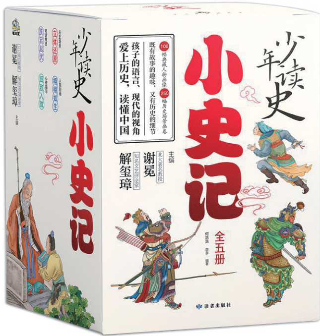
《小史记》主编:解玺璋 谢冕 出版:读者出版社

在中国传统蒙学教育中,读史原本就是很重要的内容之一。即使最初级的蒙学读本,如所谓“三、百、千”(《三字经》《百家姓》《千字文》),在识字功能之外,也不乏传播历史知识的功能。这种重视历史的教育理念显然来自儒家,在孔子办学的六门功课中,大多包含着一定的历史内容。他所使用的教材《易》《诗》《书》