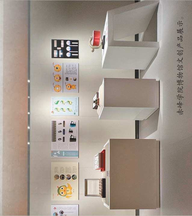
赤峰学院博物馆文创产品展示。

“红山文化坛庙冢,中华文明一象征”。从古文化到古城,再到古国,是一个漫长的历史发展过程。历经1500年,红山古国不但没有淹没在历史的烟云中,还创造出了辉煌的文明始源,着实令人赞叹。红山文化所创造的文明成就或深埋于地下,或展陈于博物馆,或隐藏于未知的角落。时至今日,我们仍然没有完全了解它,但想要走进它的初心从未改变。