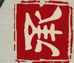
遗产保护·申遗脚步·文旅之路