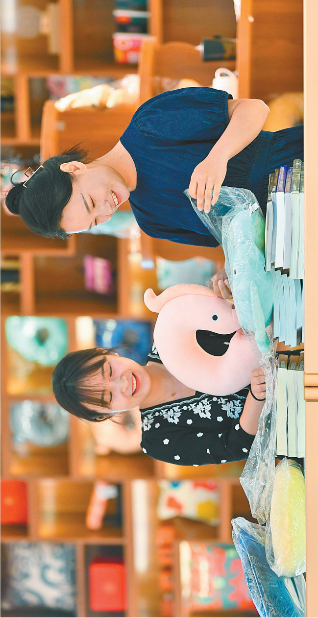
以玉龙为设计元素的颈枕受到年轻人的追捧。

今天我们积极申遗,就是对红山文化的一种肯定。2012年,红山文化遗址被列入中国世界文化遗产预备名单。