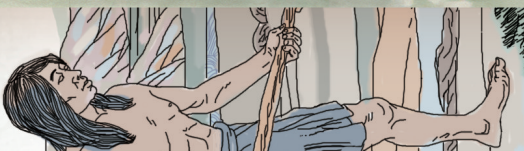
(手绘插图由苏晨绘制)