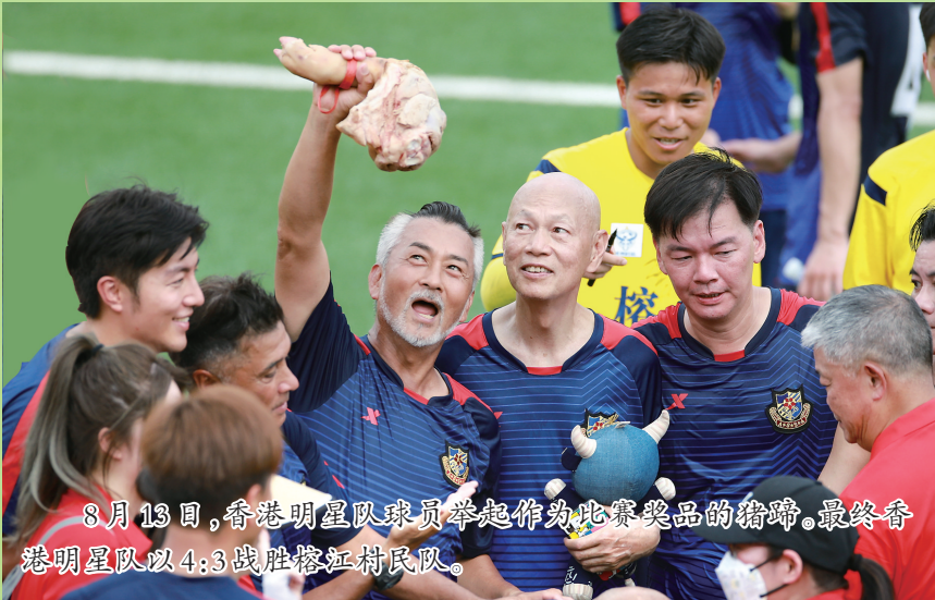
8月13日，香港明星队球员举起作为比赛奖品的猪蹄。最终香港明星队以4:3战胜榕江村民队。