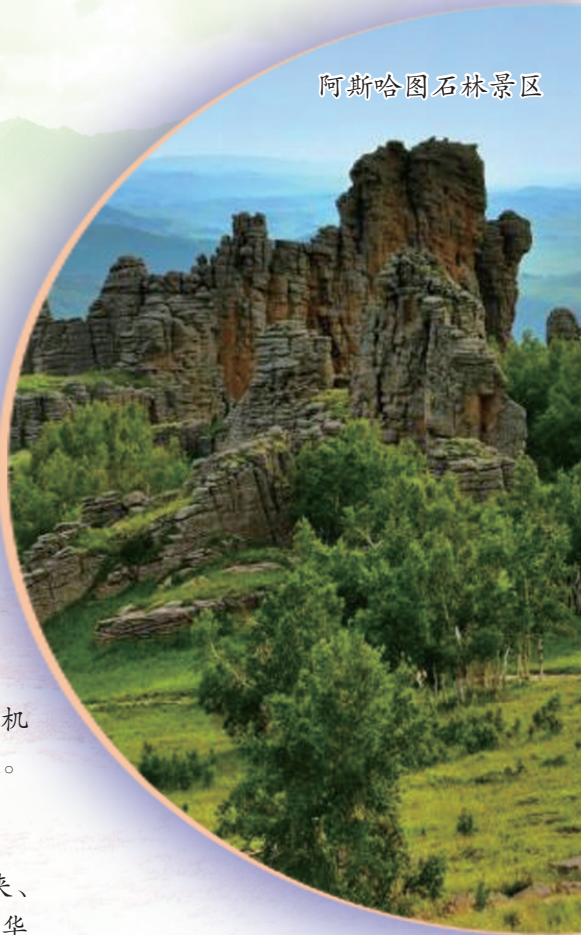
阿斯哈图石林景区

根据国务院办公厅2024年五一劳动节放假安排,本报拟定于5月1日~5月3日休刊3期,5月6日恢复出报。