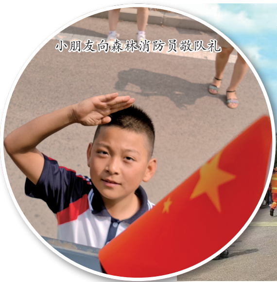
小朋友向森林消防员敬礼

会议要求,各地林草部门要围绕解决好草原过牧问题不断压实责任,既要育好草,也要管住畜,并及时推广先进经验,把典型案例作为“活教材”,为全面解决草原过牧问题打下坚实基础。同时,要加强与同级农牧部门沟通和信息共享,及时调度掌握本辖区草产业情况,构建联系服务草产业企业的常态化体系,做到底数清、情况明。会议还就进一步规范国家草原补奖资金发放和全力做好抗旱救灾饲草保供工作进行了安排部署。(帅 政)