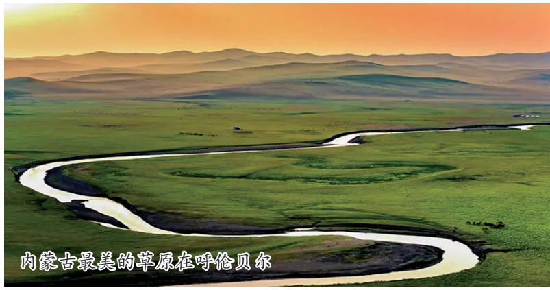
内蒙古最美的草原在呼伦贝尔

《内蒙古日报》消息 7月2日,随着华夏航空CRJ900飞机从阿拉善左旗机场腾空而起,国内最长的支支航线、阿拉善盟首条“支支通”航线——阿拉善左旗-包头-呼伦贝尔航线成功首航。西起大漠戈壁、东至天堂草原,这条支支航线的开通,为横跨2000多公里