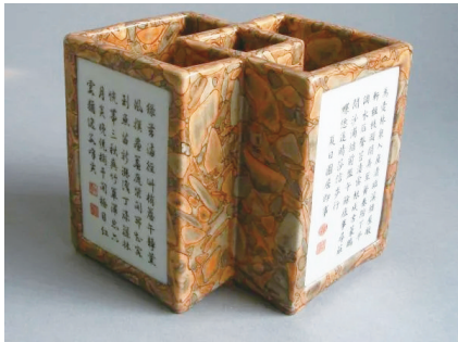
乾隆御制诗文仿石釉双联笔筒 (北京艺术博物馆藏)