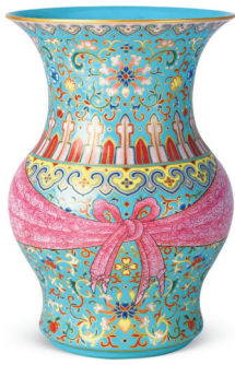
蓝地粉彩 花卉纹包袱尊