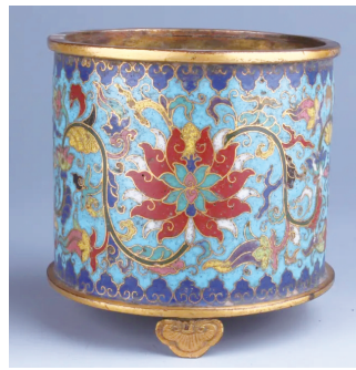
清铜胎掐 丝珐琅缠枝莲 纹炉(北京艺术 博物馆藏)