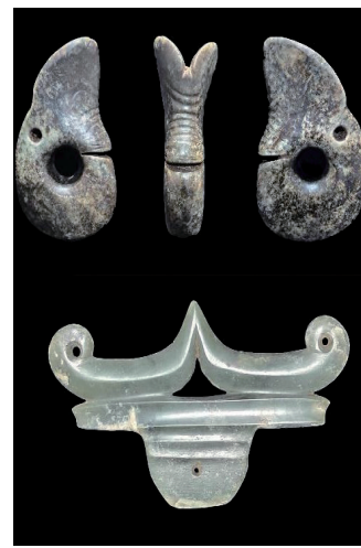
出土的玉猪龙(上)和玉冠饰(下)

元宝山积石冢的发掘为研究内蒙古地区史前考古学文化的交流与交融提供了新的资料,同时也为红山文化申遗提供了有力的学术支撑。