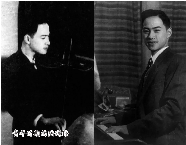
青年时期的陆道培