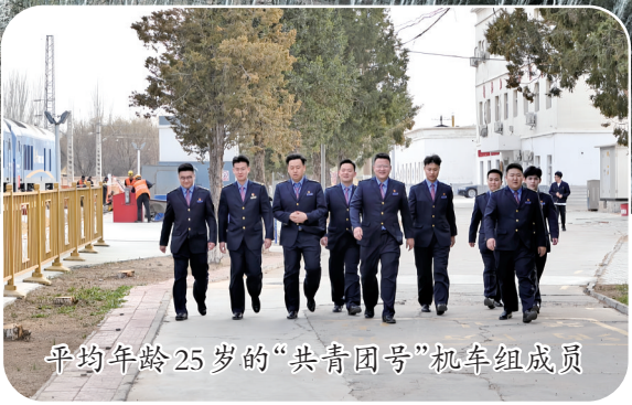
平均年龄25岁的“共青团号”机车组成员

五四青年节前夕,记者采访多名“共青团号”机车组司机长,并亲历一次穿越三大沙漠的临策铁路的值乘任务,了解这个有着65年光辉历史的先进集体的故事。作为全国铁路系统第一个以“共青团号”命名的机车组,“共青团号”历经9次更换车型、24任司机长、200多位乘务员,见证了草原铁路的飞速发展,也将共青团精神代代相传,成为铁路青年一代的标杆和楷模。