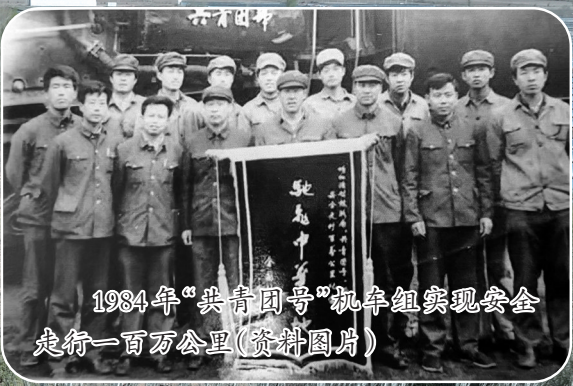
1984年“共青团号”机车组实现安全 走行一百万公里(资料图片)