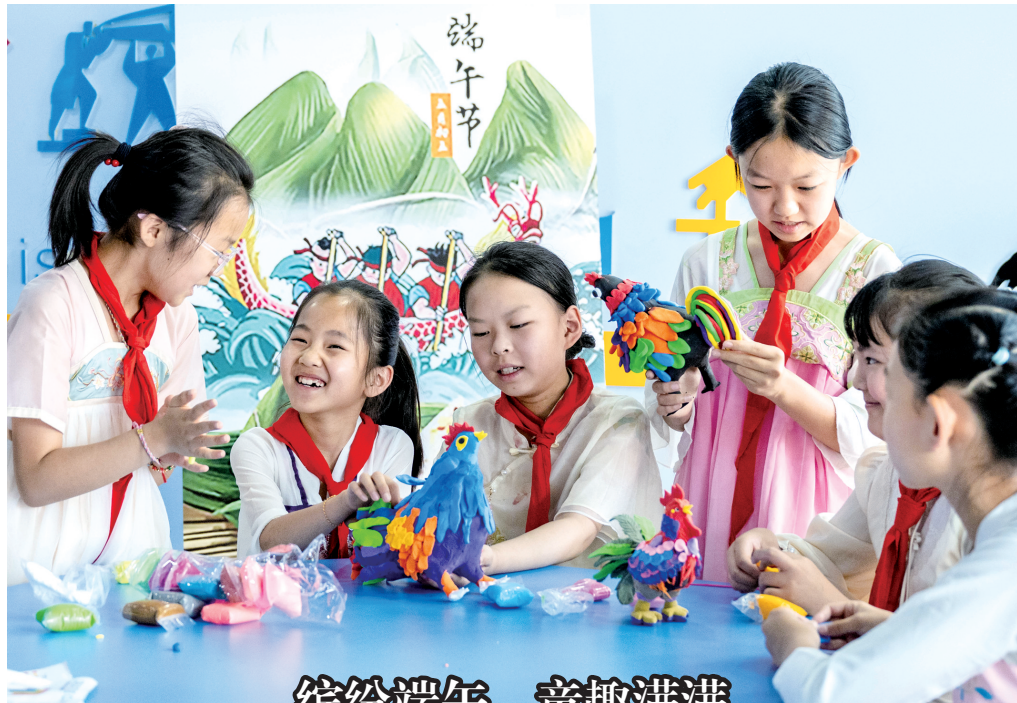
缤纷端午 童趣满满

习、创业、社交、运动、休闲娱乐等多元功能,全方位满足青年的成长与生活需求。通过青年的成长,助力城市更好地发展。