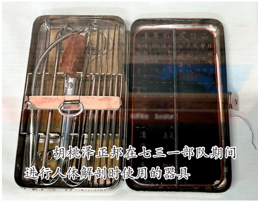
胡桃泽正邦在七三一部队期间进行人体解剖时使用的器具