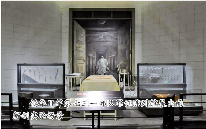
侵华日军第七三一部队罪证陈列馆展出的解剖实验场景