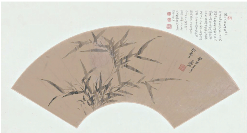
《画竹》扇面(明)倪元璐绘

宋光宗绍熙三年(1192年),朝廷下令于江南诸郡行使铁钱会子(一种纸币),66岁的杨万里上书谏阻,不奉诏,得罪宰臣,因而改任赣州知州,杨万里未去就职,而是请求任祠禄官,获授秘阁修撰、提举万寿宫。当年八月,杨万里谢病自免,回归老家吉水,隐居不再复出。他喜欢在皎洁的月光之下,清辉孤影,来到浓密的树荫下,在婆婆的竹林中,听着夏夜里悦耳的虫鸣,夜深气清,尽管没有凉风送爽,但是闷热暑气顿时消失。于是他吟