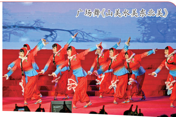
广场舞《山美水美东北美》