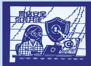
网络安全主题剪纸作品