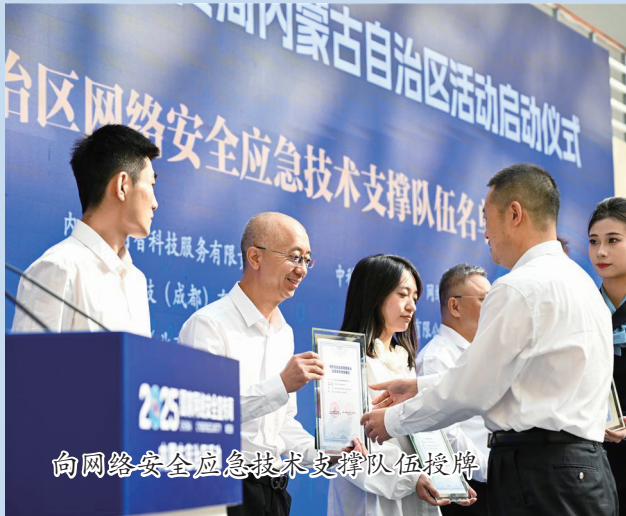
向网络安全应急技术支撑队伍授牌