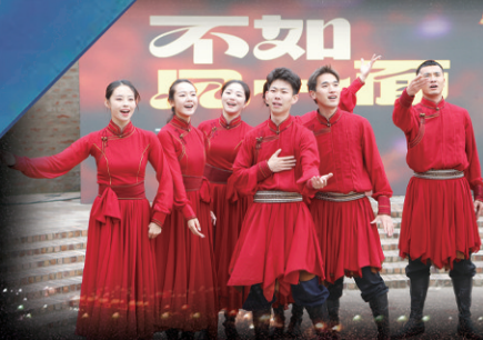
呼和浩特乌兰牧骑送上精彩表演

这个国庆，呼和浩特以深厚的文化底蕴、丰富的旅游资源、创新的活动设计和实实在在的惠民政策，诚挚邀请全国游客前来体验“万象青城 一呼百应”的独特魅力。