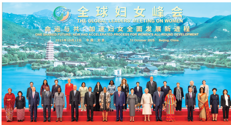
10月13日上午,国家主席习近平在北京国家会议中心出席全球妇女峰会开幕式并发表主旨讲话。这是习近平和夫人彭丽媛同与会各国和国际组织代表团团长夫妇合影留念。

题,让全体妇女共享经济全球化成果。以科技创新赋能妇女事业高质量发展,努力让广大妇女在世界现代化大潮中人生出彩、梦想成真。