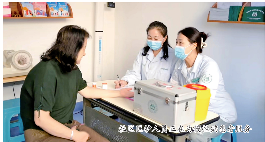
社区医护人员正在为慢性病患者服务

国际方面,深化“航空+旅游”融合,开通至蒙古国、韩国、越南、泰国、马来西亚等航班,已运送国际旅客7.1万人次。国内方面,加密至广州、成都、西安、合肥等枢纽航班,并将多条经停航线优化为直飞。依托“干支通全网联”试点,构建以鄂尔多斯为中心的中转网络,中转旅客量已突破18万人次。