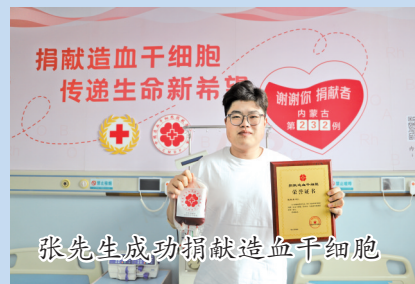
张先生成功捐献造血干细胞