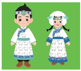
“蒙”字标大草原优品卡通IP形象“萌萌”(右)与“悠悠”