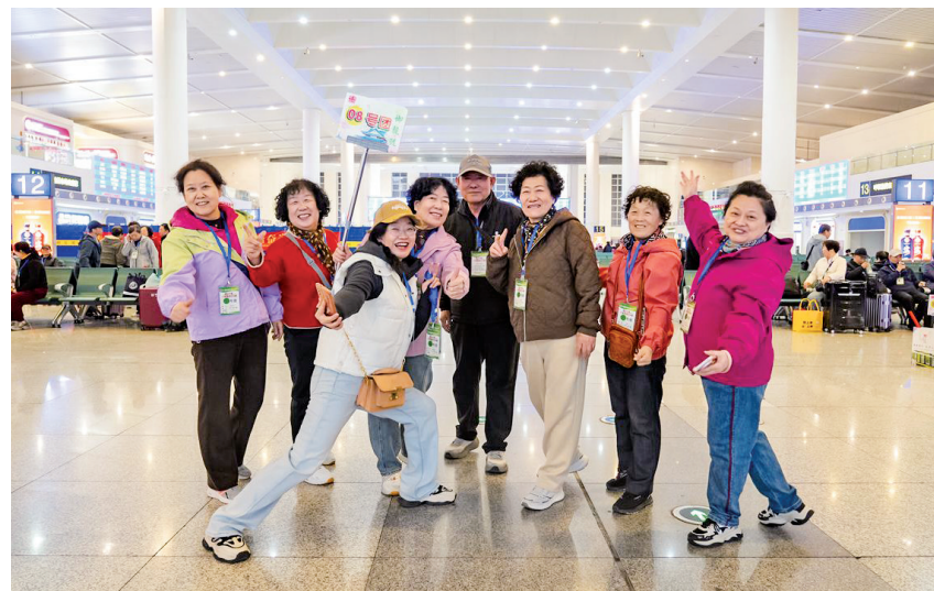
游客合影留念

近年来, 中铁呼和浩特局深耕“旅游+专列”融合促进产业升级, 坚持“火车向着景区开”, 针对中老年游客的出行需求和特点, 不断优化旅游线路、创新特色服务, 精心打造高品质旅游专列产品, 催生更多新的旅行体验, 满足旅客多样化、个性化需求, 助力旅游市场和经济社会发展。