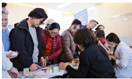
义诊活动现场为蒙古国乌兰巴托群众免费发放蒙药