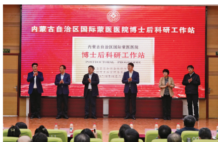
自治区首个医疗领域博士后科研工作站成立