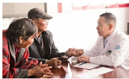
健康乌兰牧骑下基层