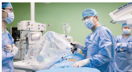
医院骨外科使用手术机器人对患者进行手术