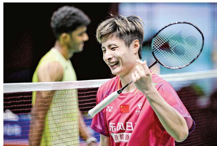
石宇奇赛后庆祝夺冠

伤愈复出后的石宇奇并没有放弃。2023年至2024年,他逐步找回状态,在印度公开赛、印尼公开赛等赛事中接连夺冠,世界排名稳步回升。2025年是石宇奇重返巅峰的关键一年:5月,他帮助国羽夺得苏迪曼杯团体冠军;8月,他逆转击败昆拉武特,夺得世锦赛冠军,终结了国羽男单10年世锦赛“冠军