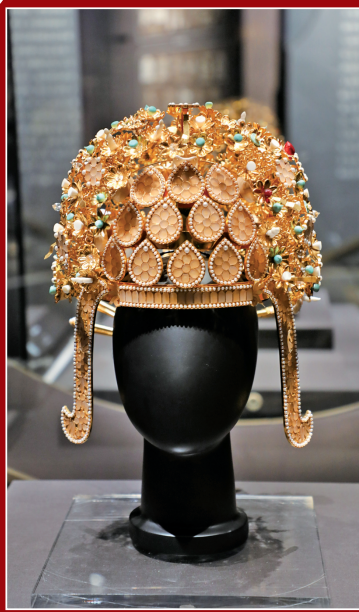
唐钗钗礼冠(复制品)