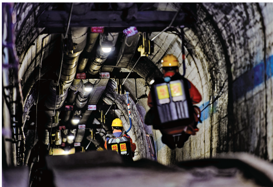
24日,国家矿山应急救援山西华阳队队员进入矿井展开搜救。

长治市委副书记、市长陈向阳在新闻发布会上介绍,事故发生后,当地迅速启动煤矿生产安全事故应急响应,投入救援专业力量335人、医护人员420人,调取周边移动高压氧舱和86辆救护车开展应急救援、医疗救治等相关工作,