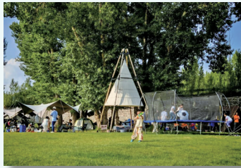
蒲公英石人湾生态露营地