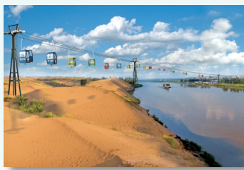
神泉生态旅游景区