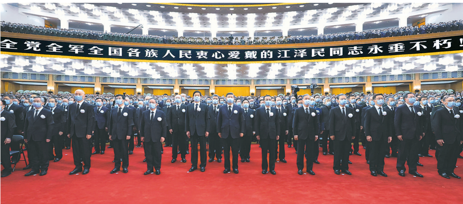
12月6日,中共中央、全国人大常委会、国务院、全国政协、中央军委在北京人民大会堂隆重举行江泽民同志追悼大会。习近平、李克强、栗战书、汪洋、李强、赵乐际、王沪宁、韩正、蔡奇、丁薛祥、李希、王岐山等参加大会。