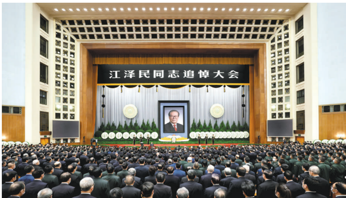
12月6日,中共中央、全国人大常委会、国务院、全国政协、中央军委在北京人民大会堂隆重举行江泽民同志追悼大会。