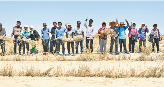
科尔沁沙地上,吃苦耐劳的治沙人。