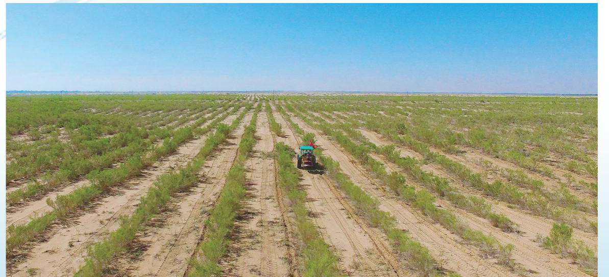
巴彦淖尔市磴口县,工作人员驾驶大型机械在乌兰布和沙漠梭梭林中接种苁蓉。