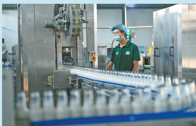
内蒙古沙漠之花生态产业科技有限公司依托敖汉旗丰富的林产优势资源,形成了从育苗种植、食品研发、生产加工到销售服务的沙棘全产业链运营模式。