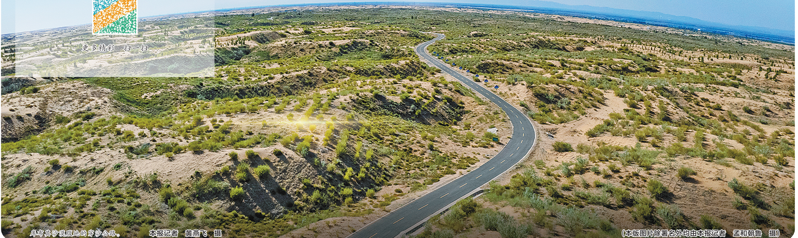
库布其沙漠腹地的穿沙公路。