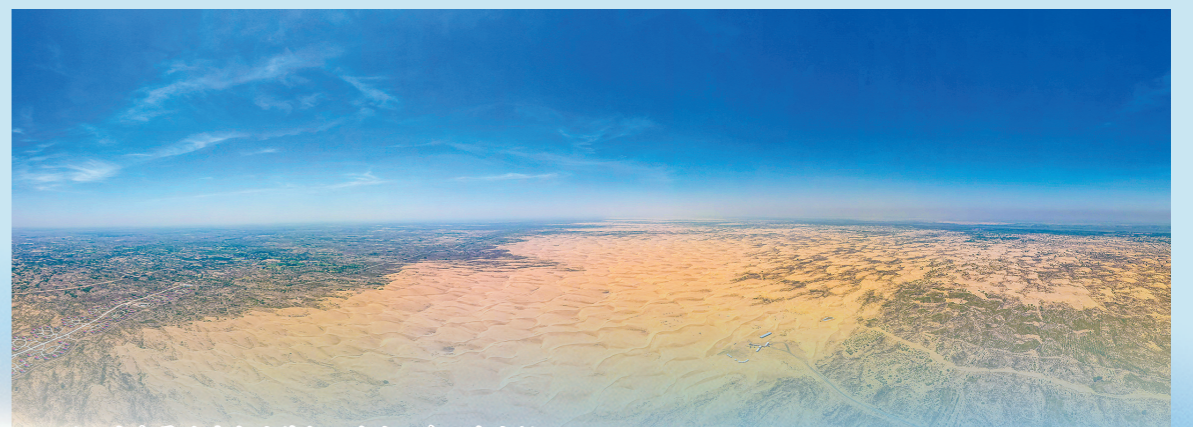
通辽市奈曼旗境内的科尔沁沙地正在逐渐变绿。