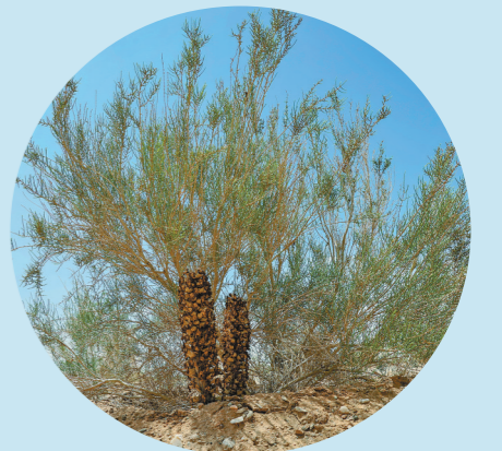
在阿拉善左旗,梭梭和苁蓉一起生长。