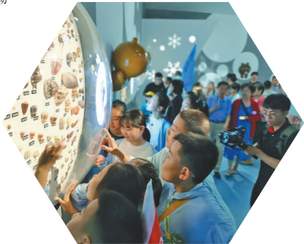
畅游极地海洋世界。