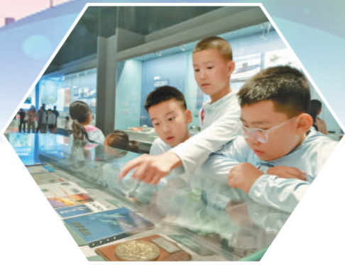
少年儿童参观海军博物馆。