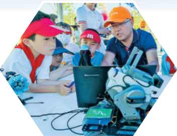
在机器人编程活动中学习。