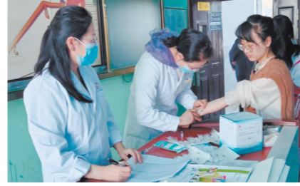
深入学校为学生体检。