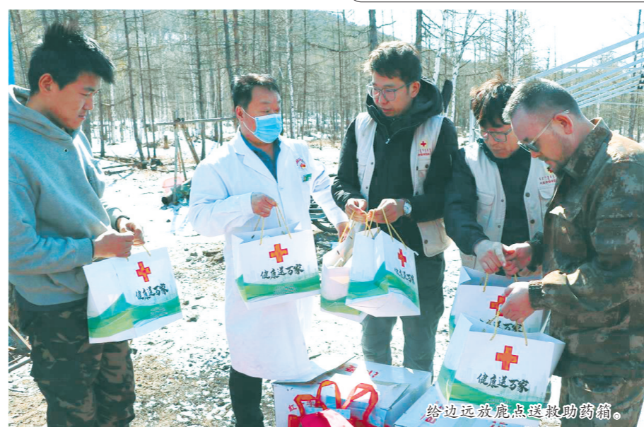
冷极「冷极」护佑健康 冷极「冷极」护佑健康

的家风德行,整个村落就组成了一座高雅的诗词博览园,成为了察右前旗农村别具特色的一道风景线。2016年,中华诗词学会在王贵沟村挂牌成立了内蒙古第一个“中华诗词村”。2017年,王贵沟农牧民诗词大赛举行,吸引了