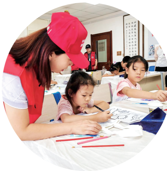
阿拉善盟退役军人志愿服务队开展“关爱青少年”志愿服务活动。