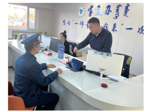
阿拉善盟退役军人事务局领导到盟政务服务窗口体验服务流程。