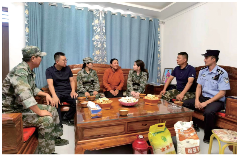
阿拉善盟退役军人志愿服务队开展“爱边守边固边”志愿服务活动——走访慰问居边护边堡垒户。