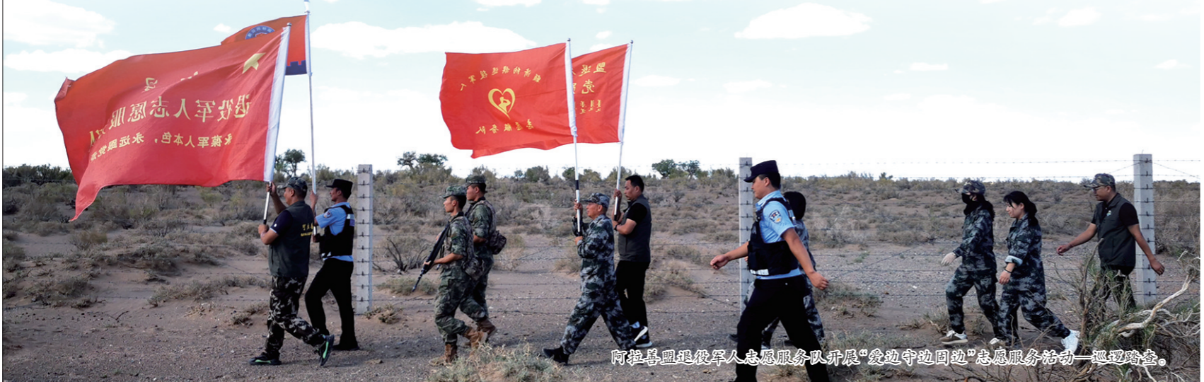
阿拉善盟退役军人志愿服务队开展“爱边守边固边”志愿服务活动——巡逻巡查。