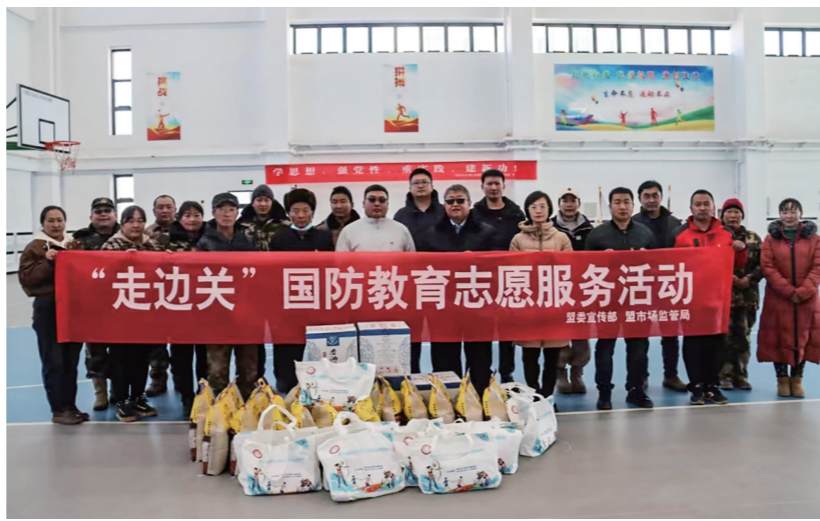
阿拉善盟委宣传部、盟市场监管局联合组建国防教育志愿服务小队,深入乌力吉苏木温都尔毛道嘎查,开展国防教育实践活动。