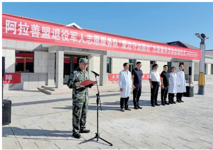
阿拉善盟退役军人志愿服务队“爱边守边固边”志愿服务活动启动仪式。