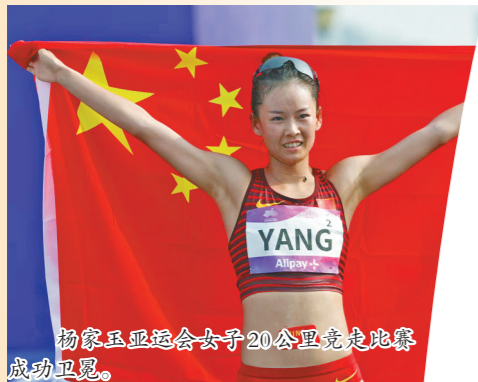
杨家玉亚运会女子20公里竞走比赛成功卫冕。

自治区十五运不断推动冬、夏季项目均衡发展,在选拔人才的同时,开创了冬、夏项目,群众体育、竞技体育协调发展的新格局。各单项竞赛规程设置严格遵照青少年生长发育规律、运动员成才规律、运动技能形成规律,对各项参赛年龄组别进行科学划分,达到夯实基础、锻炼队伍、发现人才的目的。赛程安排持续时间长,赛事热度不断,全面提升了公众对赛事的关注度、喜爱度、支持度和参与度。