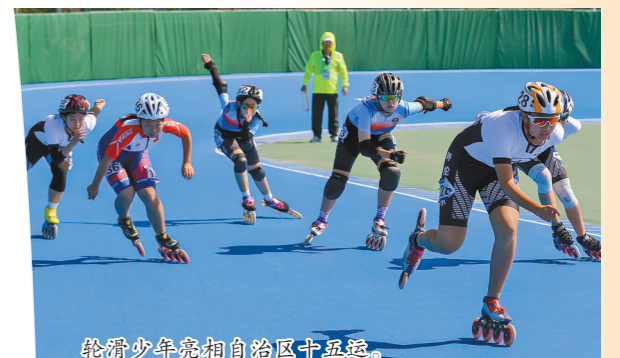
轮滑少年亮相自治区十五运。