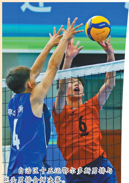
自治区十五运鄂尔多斯男排与包头男排会师决赛。