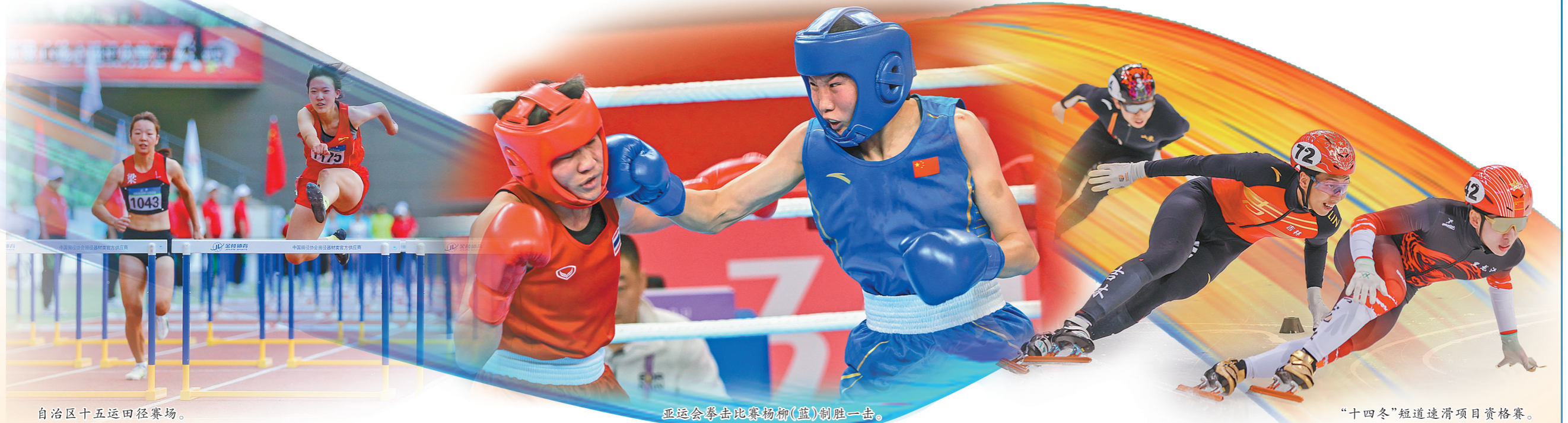
自治区十五运田径赛场。