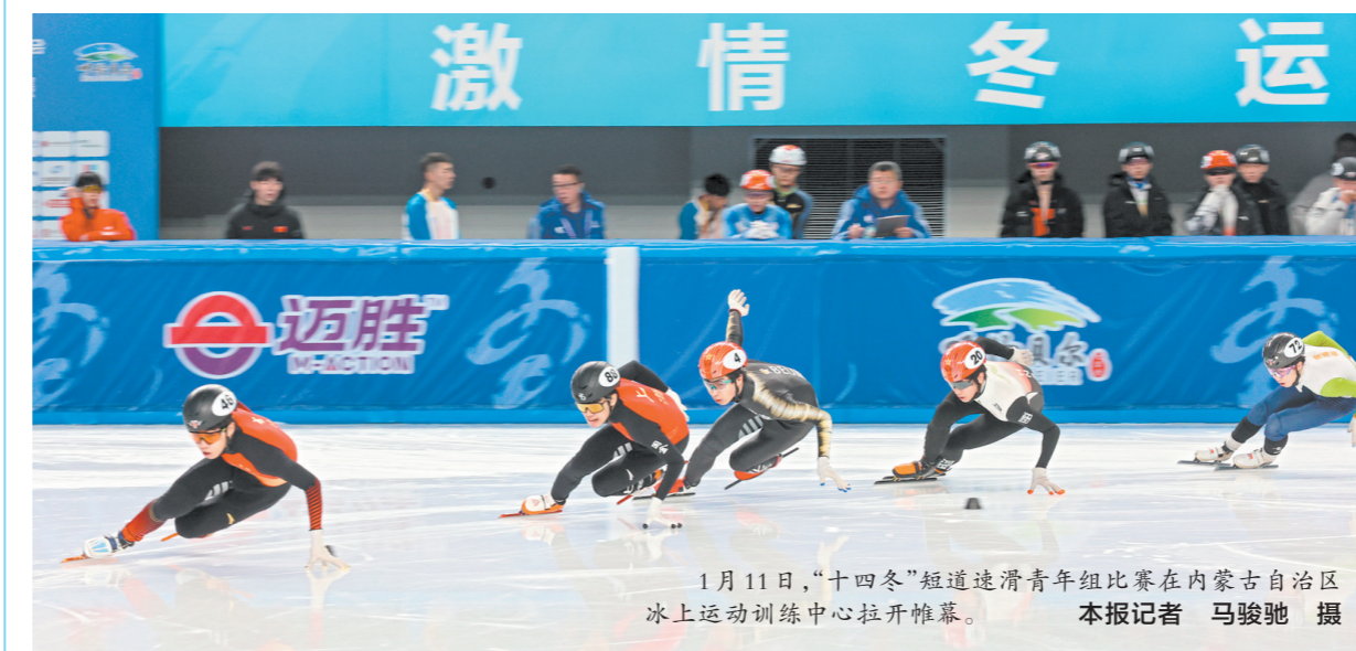
1月11日,“十四冬”短道速滑青年组比赛在内蒙古自治区冰上运动训练中心拉开帷幕。

本报呼伦贝尔1月11日电(记者 柴思源 李超然)1月11日,“十四冬”短道速滑青年组比赛在内蒙古自治区冰上运动训练中心拉开帷幕。本次比赛荟萃了吉林、黑龙江、上海、内蒙古、新疆、北京、辽宁、山东、湖北、四川、河南、天津、河北等地的精英。比赛首日进行了女子1500米和男子1500米四分之一赛、女子500米、1000米预赛以及男子500米、1000米预赛。短道速滑青年组角逐,女子方面,以王晔、宋佳蕊、宋一霏、南佳廷为首的吉林队实力最雄厚。男子奖项的竞争主要来自黑龙江、吉林、内蒙古、上海和新疆选手。“十四冬”资格赛中,黑龙江刘福霖、田昶硕包揽了500米第