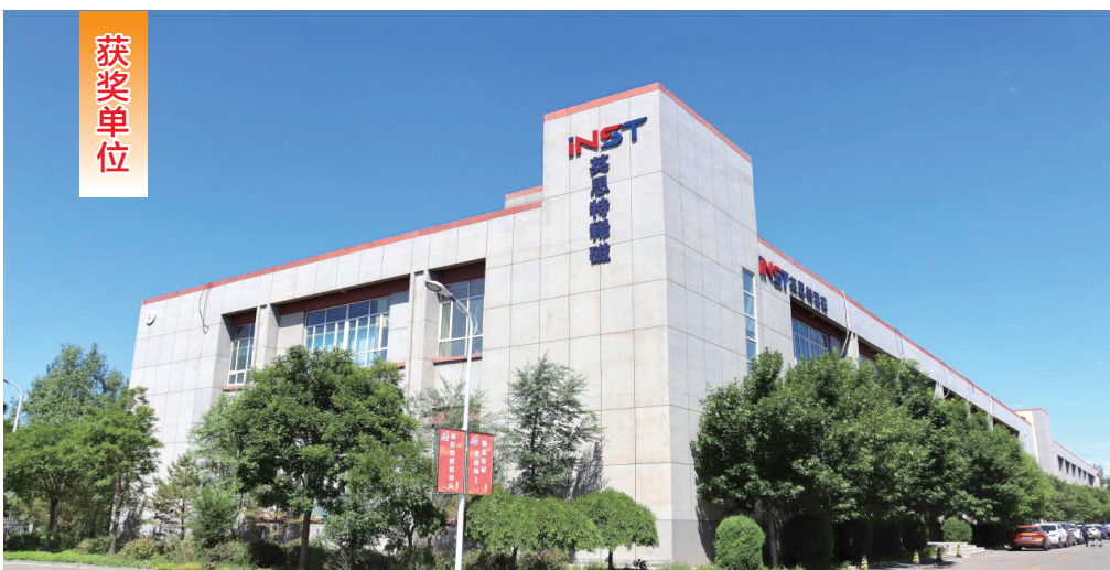
包头市英思特稀磁新材料股份有限公司