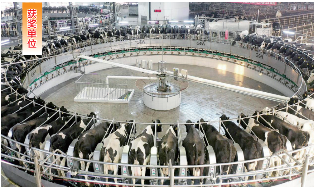
内蒙古优然牧业有限责任公司