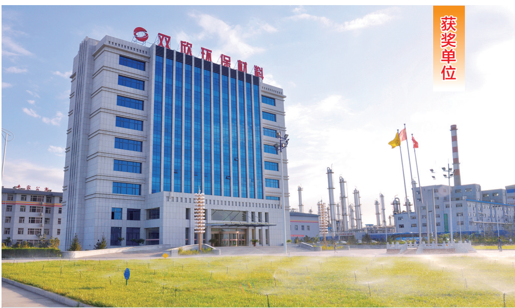
内蒙古双欣环保材料股份有限公司