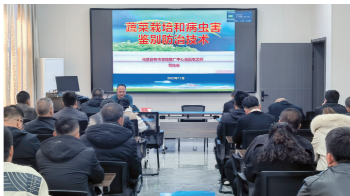
乡村振兴主题培训班。

与此同时,为加强嘎查村干部实践锻炼,该市还因地制宜将两件大事等中心任务进行分解,按照任务量化到村,责任细化到人,有针对性地给每个嘎查村安排一定的任务,并在公开栏进行公示,推动嘎查村党组织书记在推进任务落实中不断提升解决问题的能力、发动群众能力。强化与职业院校、农牧业科研单位的交流协作,邀请农牧业专家、科技特派员深入基层,走到田间地头,坐