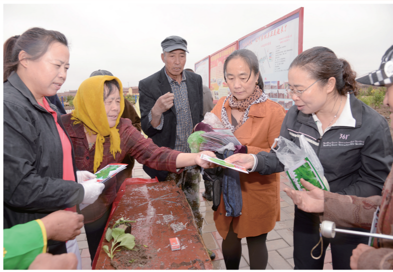
村干部宣传科学种田。