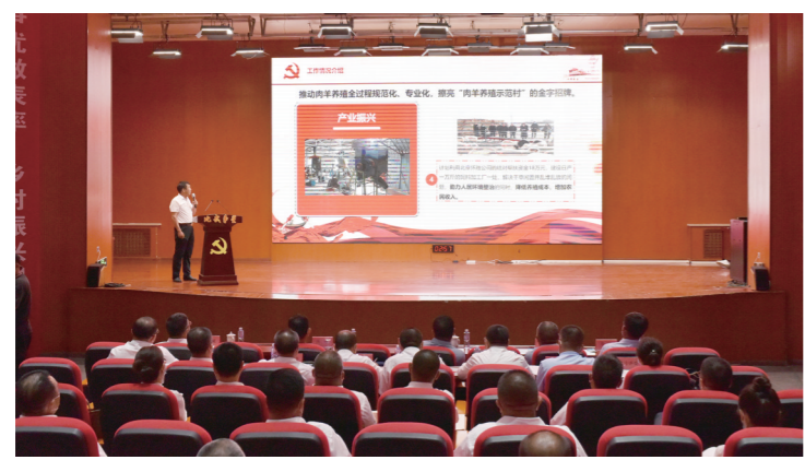
四子王旗农村牧区基层党组织乡村振兴“亮晒比”创先争优暨“比武争星”擂台赛现场。

好干部是选出来的,也是培养出来的。坚持把提升干部能力摆在重要位置,创新培养锻炼模式,让干部能力跟得上发展节拍、