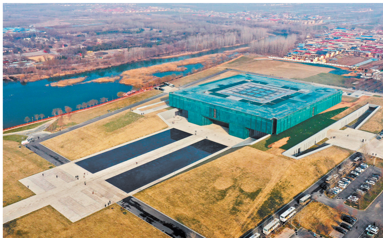
这是2024年2月26日拍摄的位于河南省安阳市的殷墟博物馆新馆(无人机照片)。