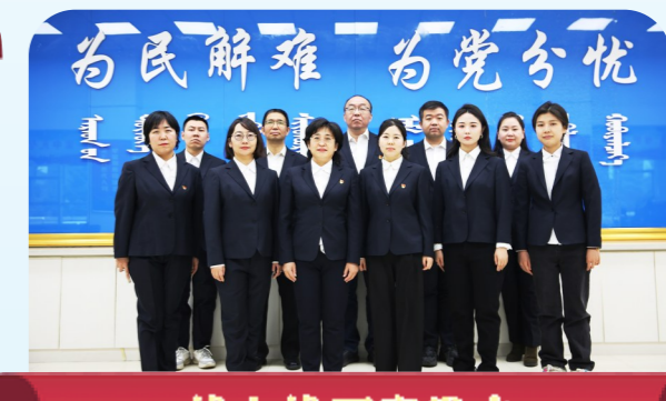
为民解难 为党分忧 ——内蒙古自治区信访局网络信访处