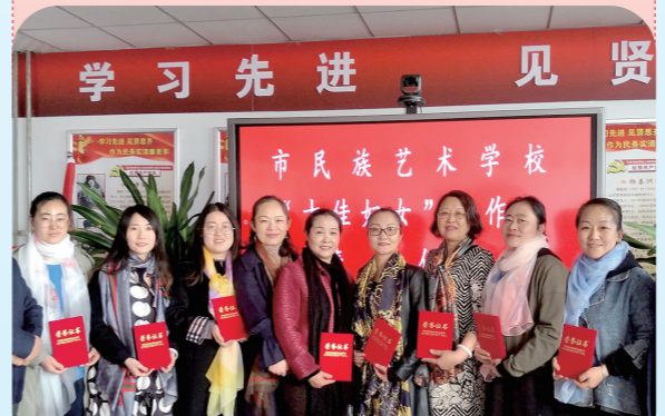
学习先进 见贤思齐 市民族艺术学校

乌兰察布市艺术学校教职工总人数175人,女教职工116人。学校的女教职工专业领域涉及声乐、器乐、舞蹈、书法、美术、茶艺以及各文化学科,她们不仅坚守在教学一线,也同样活跃在乌兰察布市各类文艺演出的台前幕后。她们在妇联组织和校领导的指导下,持续斩获殊荣。为了突出引领作用,带动女教职工向“双师型教师”转变,2021年7月起,乌兰察布市艺术学校妇委会先后多次组织女教职工参加培训,让她们掌握了理论知识和实践技能。学校现有33名中级“双师型”教师和52名初级“双师型”教师。