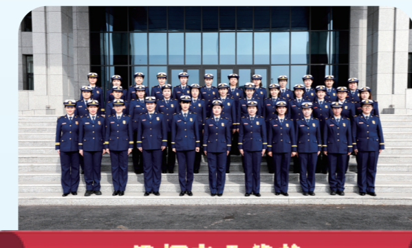
发挥专业优势 全力守护消防安全 呼和浩特市消防救援支队女子消防监督服务先锋队

呼和浩特市消防救援支队女子消防监督服务先锋队成立于2020年,是内蒙古自治区第一支女子消防服务队。她们以保障群众生命安全和辖区稳定为目标,持续开展消防安全专项整治、消防安全大排查大起底大整治活动,排查治理火灾隐患,全程推行“指导式”检查、“说理式”执法,展现队伍服务为民的新形象;她们服务在人民群众最需要的地方,全力优化志愿服务活动,切实做好群众举报投诉工作,发挥消防专业优势积极承担各项任务,严守各类场所安全,主动作为,以实际行动向驻地传递党和政府的温暖;倡导“习惯安全、人人消防”理念,组建“北疆蓝焰”女子消防宣传队,推进消防安全宣传教育“五进”活动,培养全民消防安全习惯。