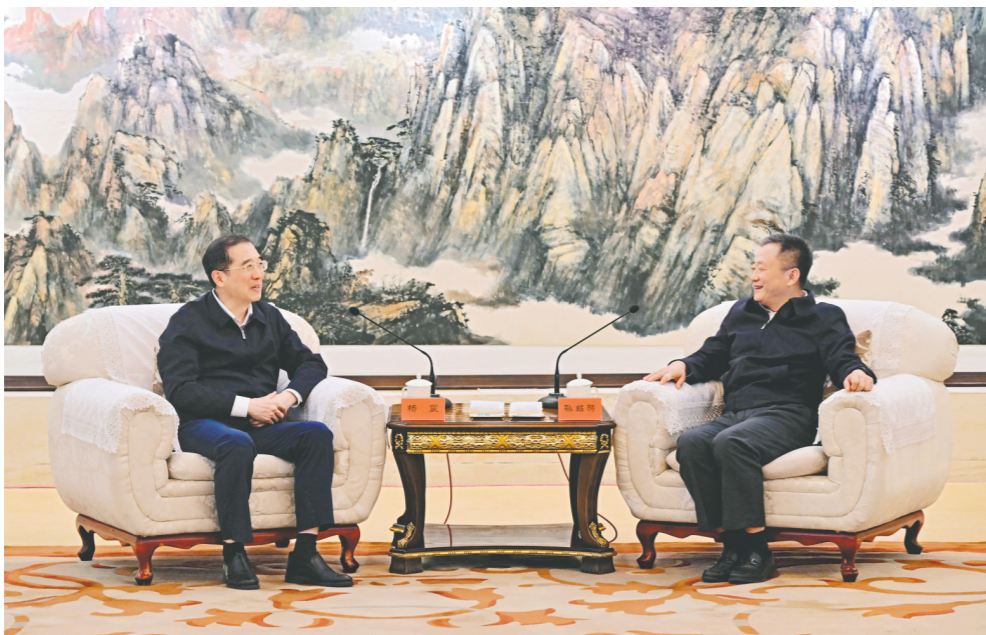
五月十六日,自治区党委书记孙绍骋在呼和浩特拜会全国政协副主席、农工党中央常务副主席杨震。