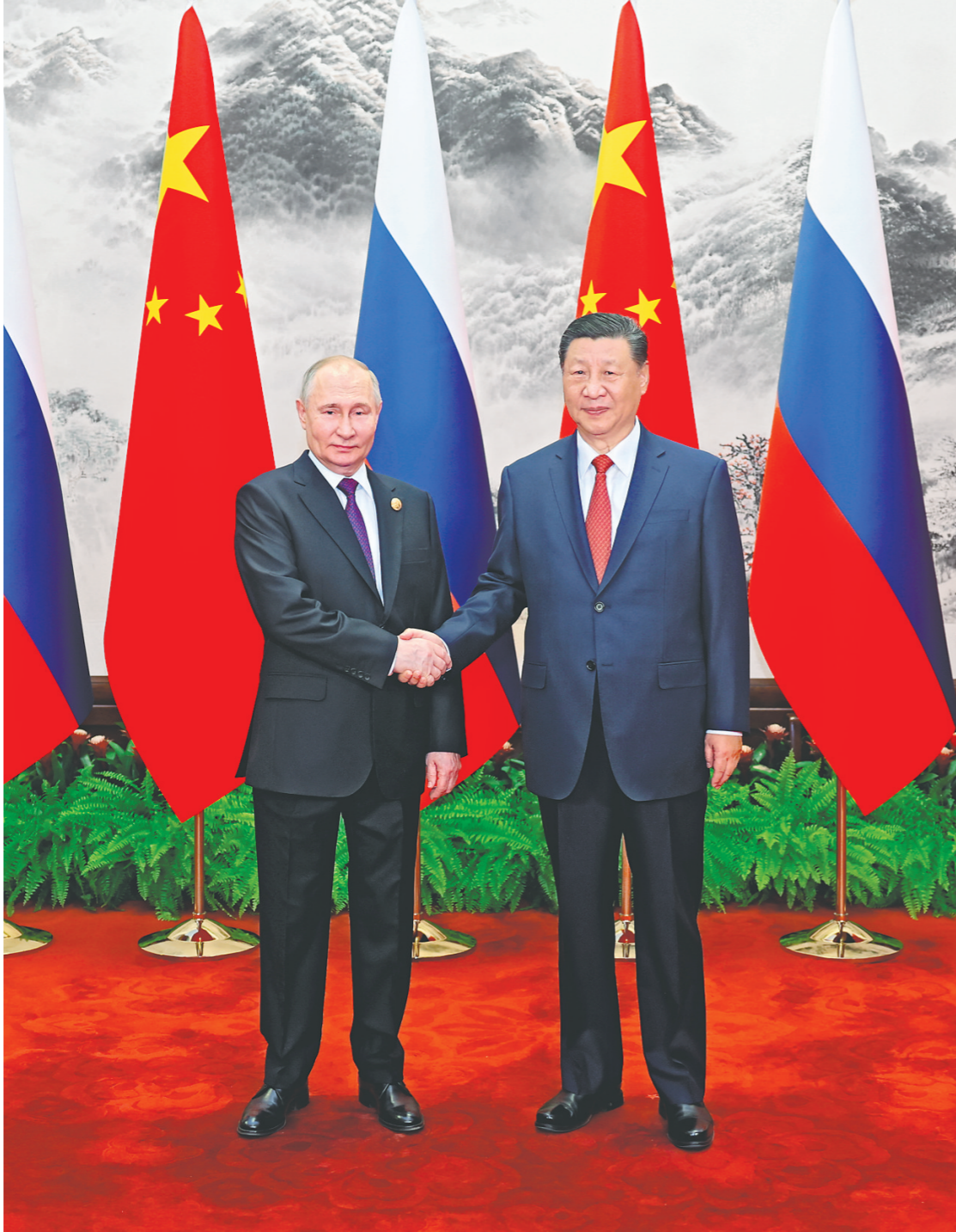
5月16日上午,国家主席习近平在北京人民大会堂同来华进行国事访问的俄罗斯总统普京举行会谈。这是习近平同普京握手。