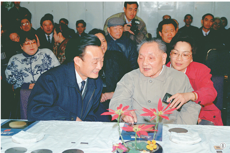
图①:1992年2月10日,邓小平同志在上海贝岭微电子制造有限公司参观时与吴邦国同志交谈。