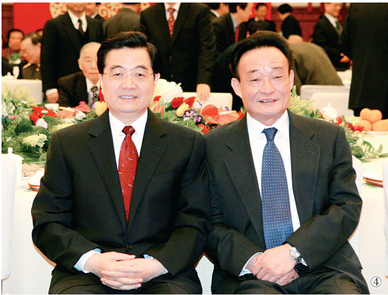
图④:二〇〇五年一月一日,全国政协在北京举行新年茶话会。这是胡锦涛同志与吴邦国同志在一起。