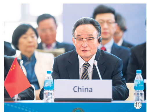
图⑪:2013年1月28日,吴邦国同志在俄罗斯符拉迪沃斯托克出席亚太经合组织第21届年会,并作题为《坚持和平发展 促进合作共赢》的主旨发言。