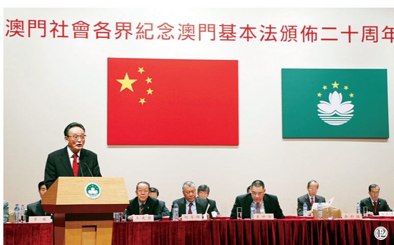
图⑫:2013年2月21日,吴邦国同志在澳门文化中心出席澳门社会各界纪念澳门基本法颁布20周年启动大会并发表讲话。