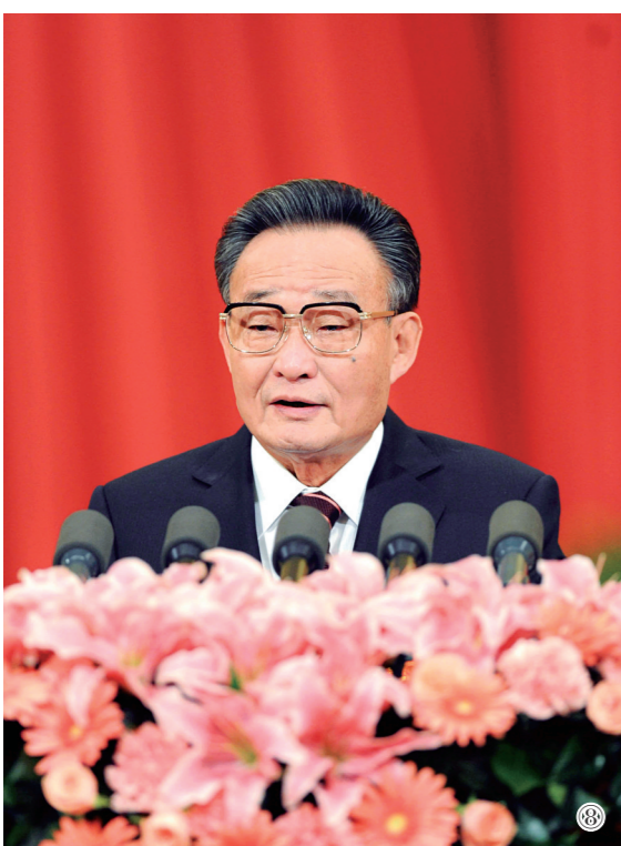
图⑧:二〇一一年三月十日,十一届全国人大四次会议在北京人民大会堂举行第二次全体会议。吴邦国同志作全国人大常委会工作报告。