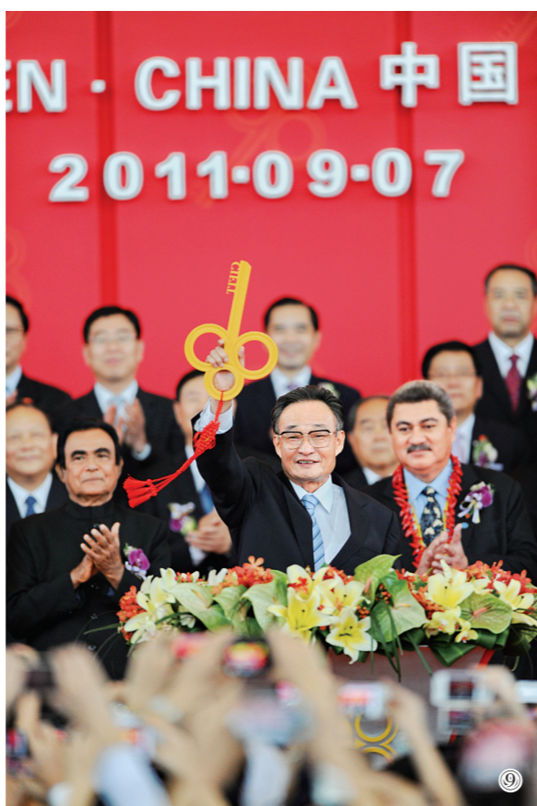
图⑨:二〇一一年九月七日,吴邦国同志在福建厦门出席第十五届中国国际投资贸易洽谈会开幕式。