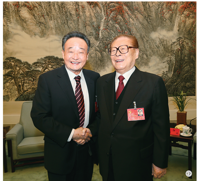
图③:2012年11月14日,中国共产党第十八次全国代表大会在北京闭幕。这是闭幕会前,江泽民同志与吴邦国同志在一起。