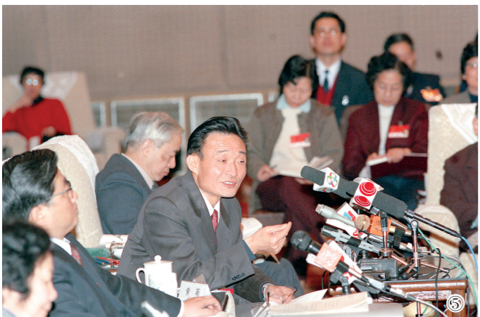
图⑤:1994年3月,时任上海市委书记的吴邦国同志在全国两会上海代表团全团会议上。