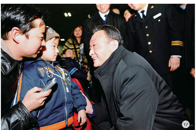
图⑥:2008年2月3日,吴邦国同志在北京西站候车室与旅客交谈。