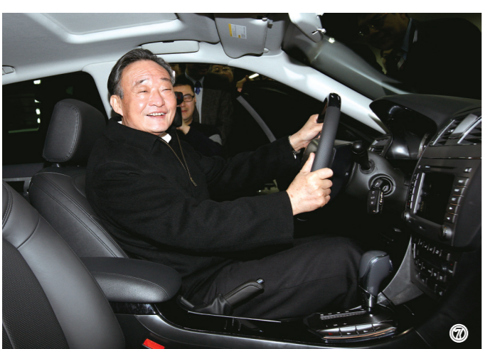
图⑦:2010年1月30日,吴邦国同志在上海汽车集团股份有限公司技术中心察看新能源样车。