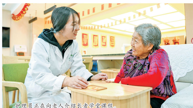
护理员正在向老人介绍长者学堂课程。

该中心在满足助餐、助医、助浴、助洁、助急、助行服务基础上,根据老年人个性化需求,不断扩展专项服务,设置了长者学堂、就诊陪护、优选代购等业务。长者学堂开展了茶艺培训、书法培训、插花培训等各类特色公益课程,受到老年人的热烈欢迎。生活在青福镇的老人们,不仅实现了从“老有所养”到“老有颐养”的转变,也满足了“自己‘不离乡邻、不离乡首、不离乡土、不离乡情’的养老情结。”