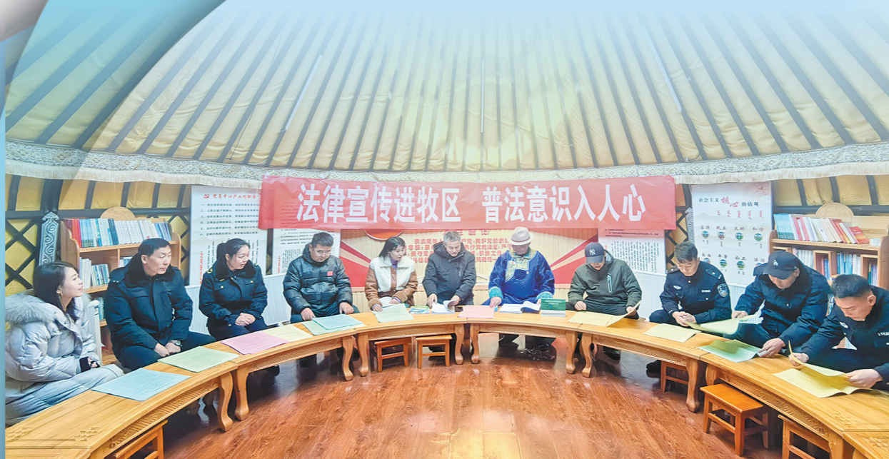
锡林郭勒盟东乌珠穆沁旗开展法律宣传进社区活动。