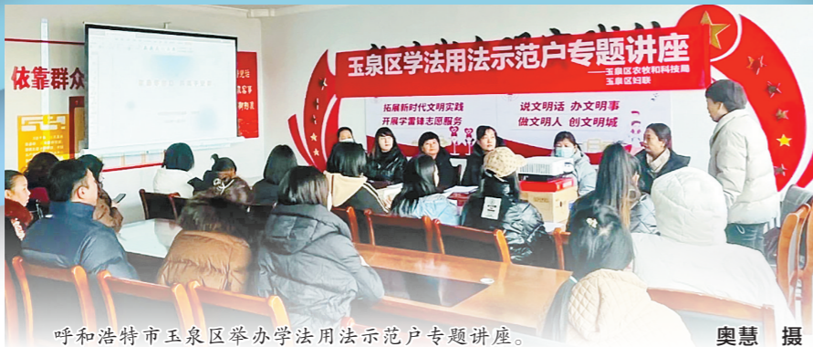
呼和浩特市玉泉区举办学法用法示范户专题讲座。

在兴安盟突泉县学田乡利民村,村民们说起吴天宇,都会竖起大拇指。“老吴调解起纠纷来,那真是不偏不倚,公平得很呢!”