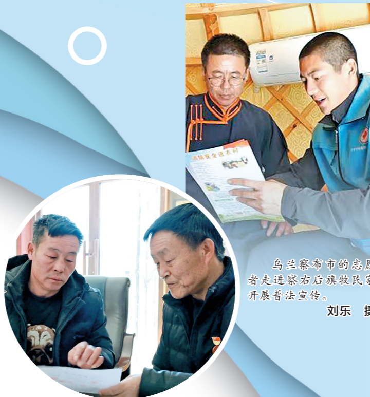
乌兰察布市的志愿者走进察右后旗牧民家开展普法宣传。

依法治理是最可靠、最稳定的治理。目前,内蒙古各地探索出一系列培育模式,形成了一些可推广、可复制的工作经验。鄂尔多斯市准格旗探索农村“积分制”管理模式,学法用法示范户通过积极参与村