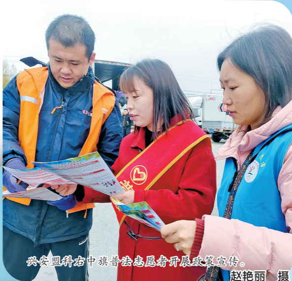
兴安盟科右中旗普法志愿者开展政策宣传。

法治之力赋能乡村振兴。真正的乡村振兴不仅表现为农村牧区产业发展和农牧民收入提高上,还表现在农村牧区治理体系现代化上。当前,内蒙古正用法治手段绘就和美乡村画卷,奏响乡村振兴奋进曲。各地各部门也将持续厚植法治沃土,让法治的“种子”在北疆大地“扎根发芽”,成为推动乡村振兴的强大引擎和重要保障。