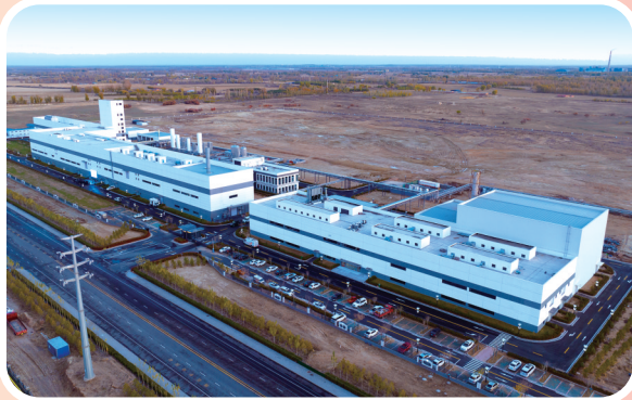
亨通光学材料有限公司高端光学新材料建设项目。