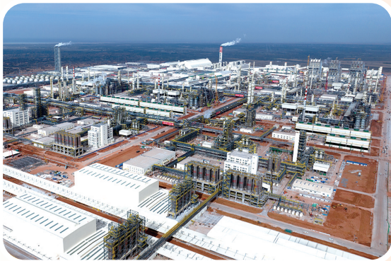
内蒙古宝丰煤基新材料年产260万吨煤制烯烃和配套年产40万吨植入绿氢耦合制烯烃项目。