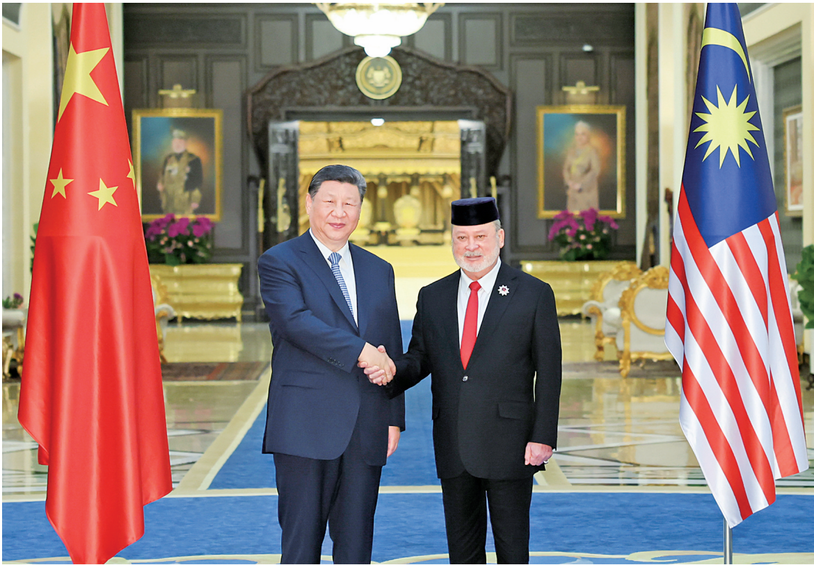
四月十六日上午，马来西亚最高元首易卜拉欣在马来西亚国家王宫同中国国家主席习近平举行会见。