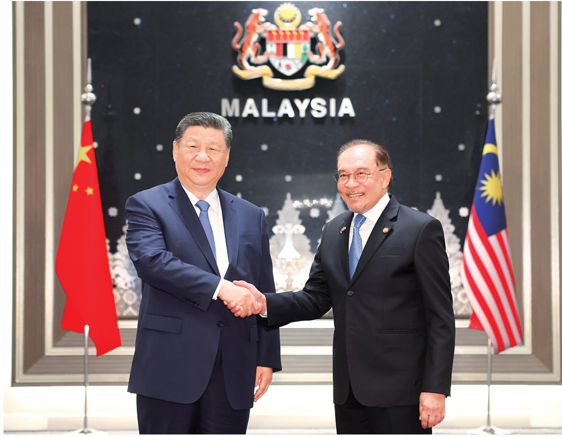
四月十六日下午，国家主席习近平同马来西亚总理安瓦尔在布特拉贾亚总理官邸举行会谈。