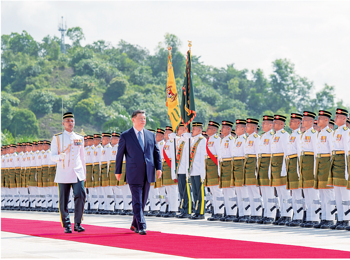
四月十六日上午，马来西亚最高元首易卜拉欣在马来西亚国家王宫同中国国家主席习近平举行会见。易卜拉欣在国家王宫广场为习近平举行隆重欢迎仪式。这是习近平检阅仪仗队。